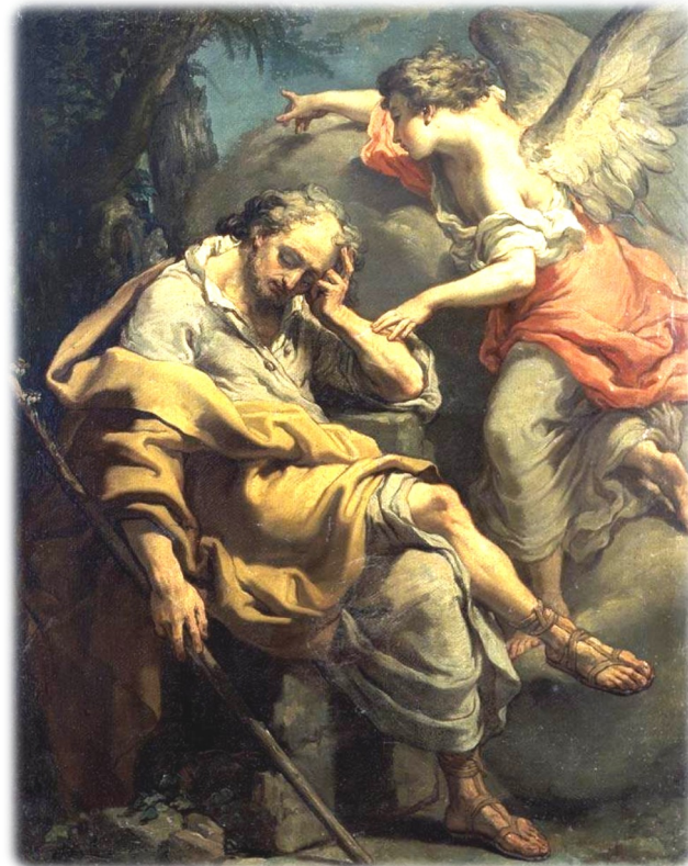
Il sogno di Giuseppe di Gaetano Gandolfi (1704-1802)

Ci siamo quasi, sta per nascere, è l’inizio. È l’inizio di un nuovo modo di abitare la vita, di un Dio che sceglie la via del grembo, del silenzio, del sogno. Un Dio che non si impone, ma si espone; che non conquista, ma si consegna. Il Vangelo di oggi ci accompagna a capire il modo in cui Dio entra nella storia, in un mondo di silenzio, di sogno: nel grembo di una donna e nel cuore di un uomo. In quel cuore di Giuseppe che si fa anch’esso culla accogliente. No, Dio non irrompe con potenza, non squarcia i cieli con fragore, ma si fa spazio nella fragilità, nel dubbio, nel silenzio, nella